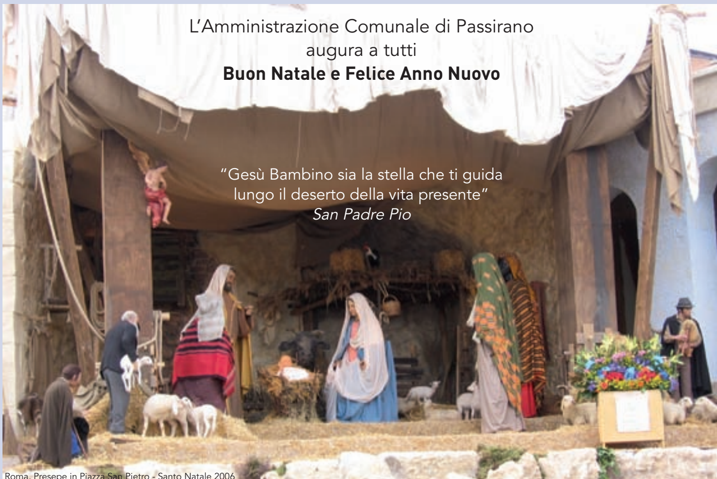
Roma, Presepe in Piazza San Pietro - Santo Natale 2006

"Gesù Bambino sia la stella che ti guida lungo il deserto della vita presente" San Padre Pio