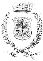
Comune di Castegnato