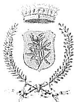
Comune di Castegnato