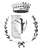
Comune di Travagliato