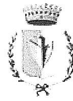
Comune di Travagliato