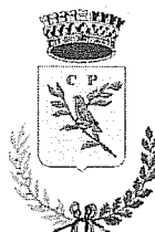
Comune di Passirano