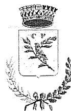
Comune di Passirano